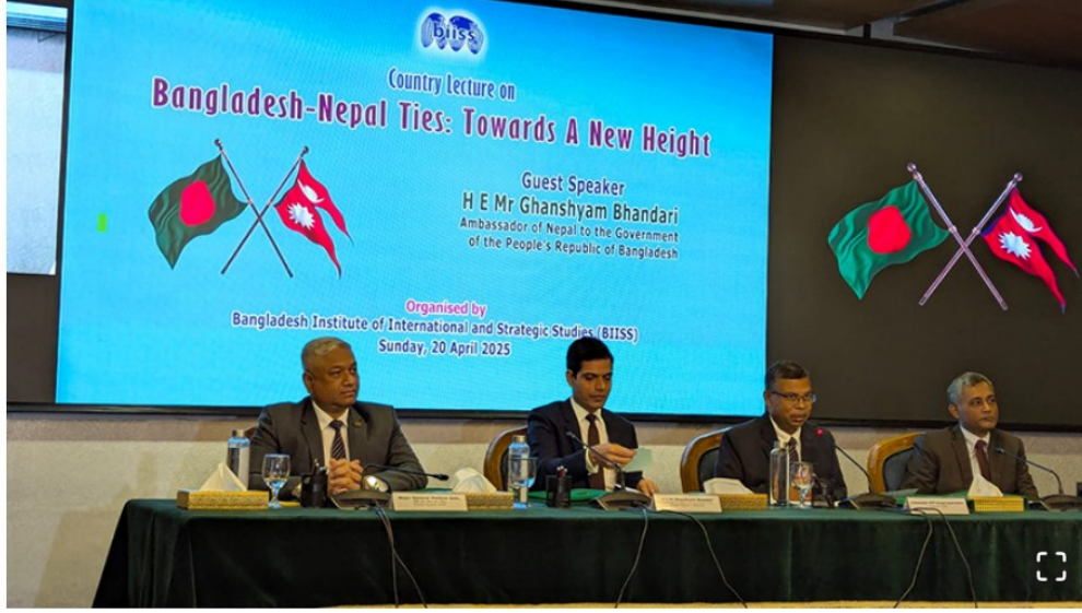
রোববার বাংলাদেশ ইনস্টিটিউট অব ইন্টারন্যাশনাল অ্যান্ড স্ট্র্যাটেজিক স্টাডিজের (বিআইআইএসএস) আয়োজনে 'বাংলাদেশ-নেপাল বন্ধন: উচ্চতার নতুন দিক' শিরোনামে সেমিনার

তিনি বলেন, ২০১৪ সালে কাঠমান্ডুতে সর্বশেষ সার্ক সম্মেলন অনুষ্ঠিত হওয়ার পর থেকে নেপাল সার্কের চেয়ার হিসেবে দায়িত্ব পালন করছে। সার্কের টেকনিক্যাল কমিটি বিভিন্ন সময়ে চেষ্টা করলেও রাজনৈতিক পর্যায়ে বাস্তবিক কোনো অগ্রগতি হয়নি। সদস্য দেশগুলো সম্মত না হলে সার্ক সম্মেলন, মন্ত্রী পর্যায়ের বৈঠক কিংবা অন্যান্য স্তরে আলোচনা এগিয়ে নেয়া সম্ভব নয়।