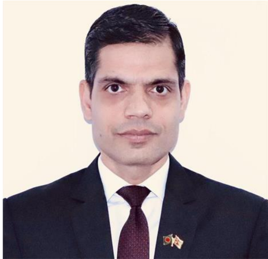
Nepalese Ambassador Ghanshyam Bhandari. -File Photo

DHAKA, April 20, 2025 (BSS) - Nepalese Ambassador Ghanshyam Bhandari today said Dhaka and Kathmandu share identical views on advancing SAARC, stressing the need for renewed political will among member states to revive the regional cooperation platform.